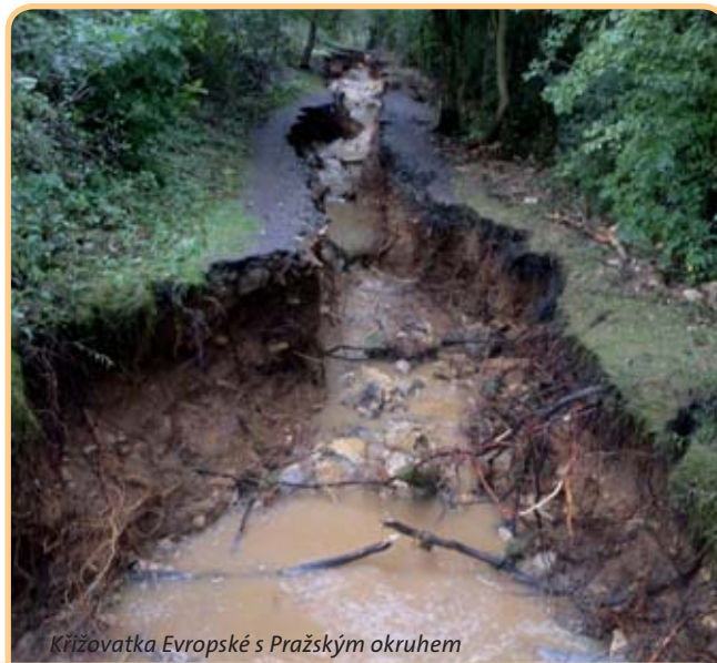
Křižovatka Evropské s Pražským okresem

U černých odběrů vody šlo v 73 % případů o manipulace s vodoměrem nebo porušení plomby, jindy měl odběratel neměřenou odbočku před vodoměrem či propojení trubkou. Při vypouštění odpadních vod na černo šlo především o nepřihlášenou kanalizační přípojku. PVK se vyhledávání černých odběrů a vypouštění věnují velmi intenzivně již několik let.